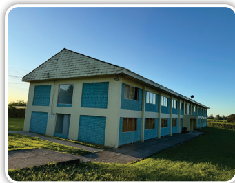
Студентски дом на Адвентистичкиот универзитет во Чиле каде што ќе помогне со даровите за ова штримесечје

Ви благодариме за вашата великодушна поддршка на овие два проекта.