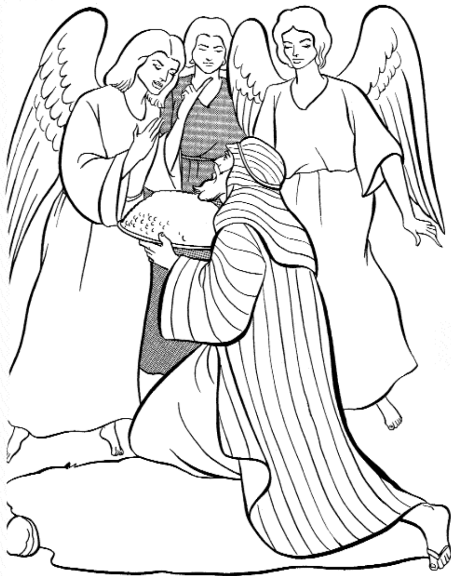
Љиљана Ћирић Дечја суботна школа, ЈИЕУ - Београд