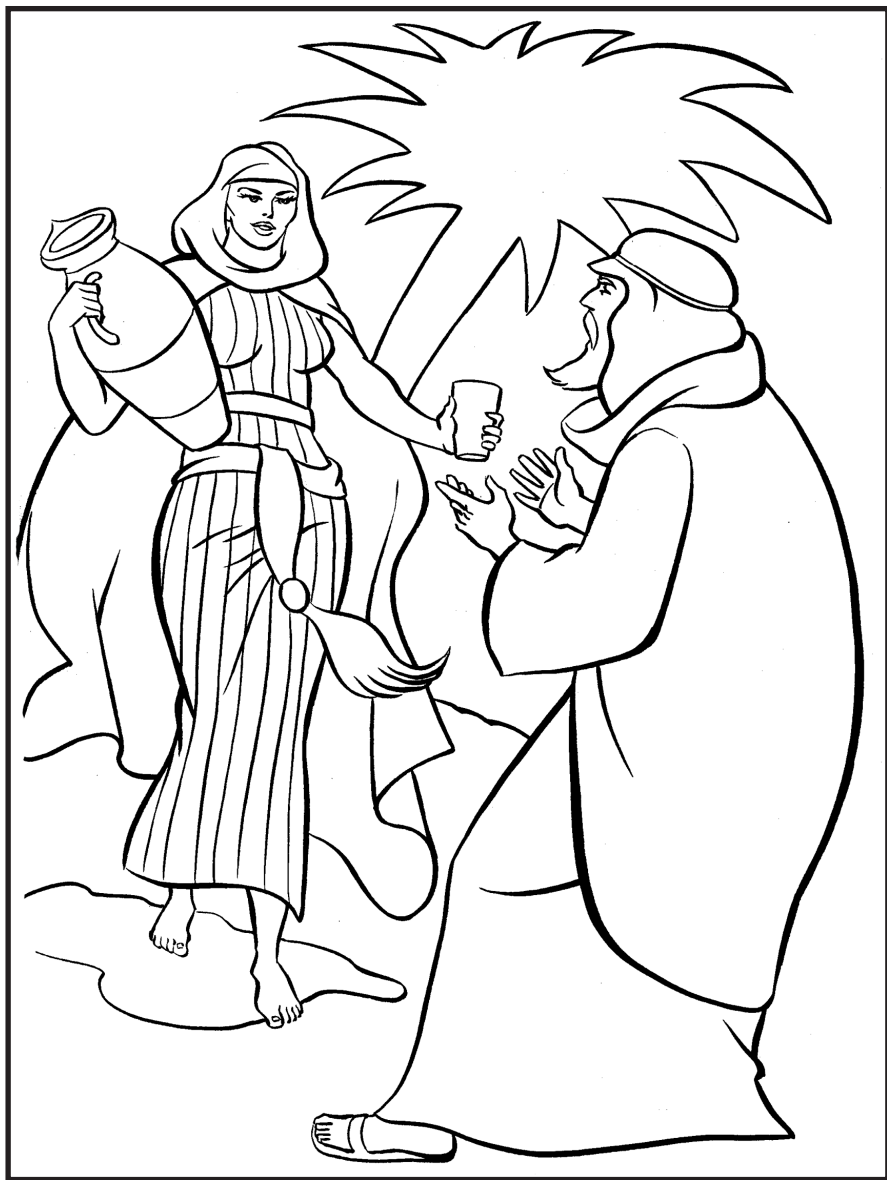
Љиљана Ћирић Дечја суботна школа, ЈИЕУ - Београд