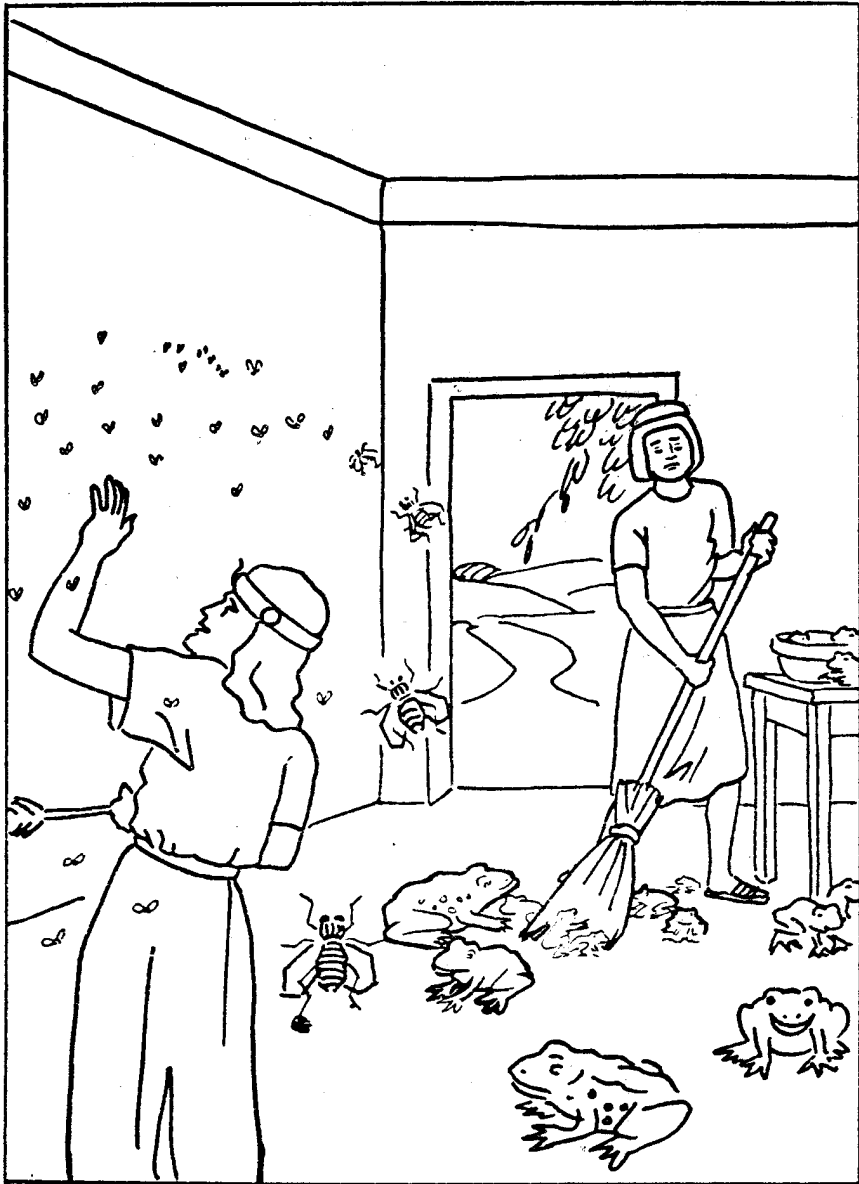
Љиљана Ћирић Дечја суботна школа, ЈИЕУ - Београд