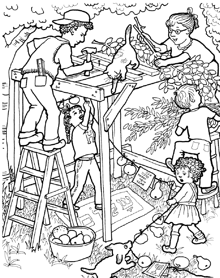
Љиљана Ћирић Дечја суботна школа, ЈИЕУ - Београд