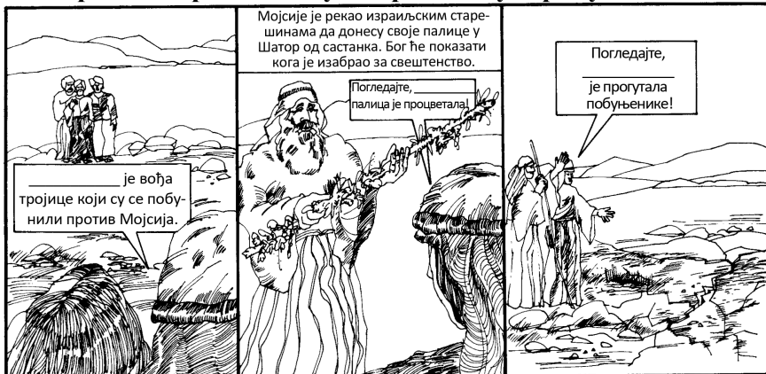
Кореј, Датан, Авирон