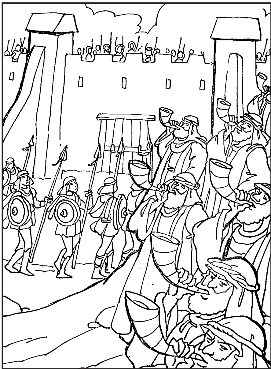
Љиљана Ћирић Дечја суботна школа, ЈИЕУ - Београд