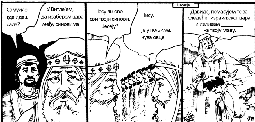
Јавиновим, Јеровоамовим, Јесејевим