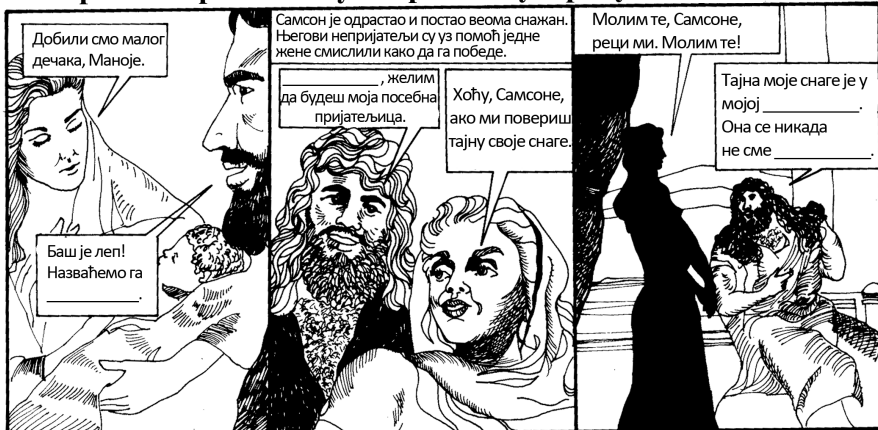
Самуило, Самсон, Саул