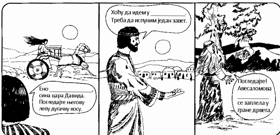
Јосифа, Јонатана, Авесалома