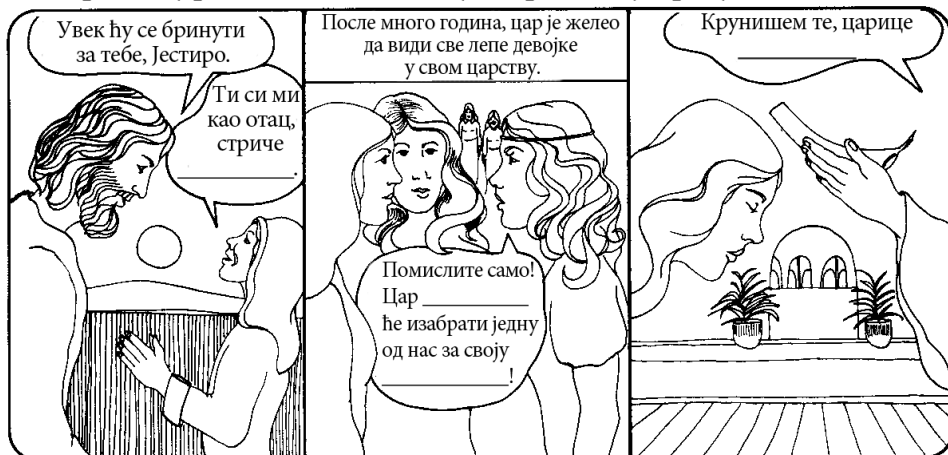
Манастија, Мардохеју, Михеју

Изабери тачну реч испод слике и попуни празнине у стрипу.