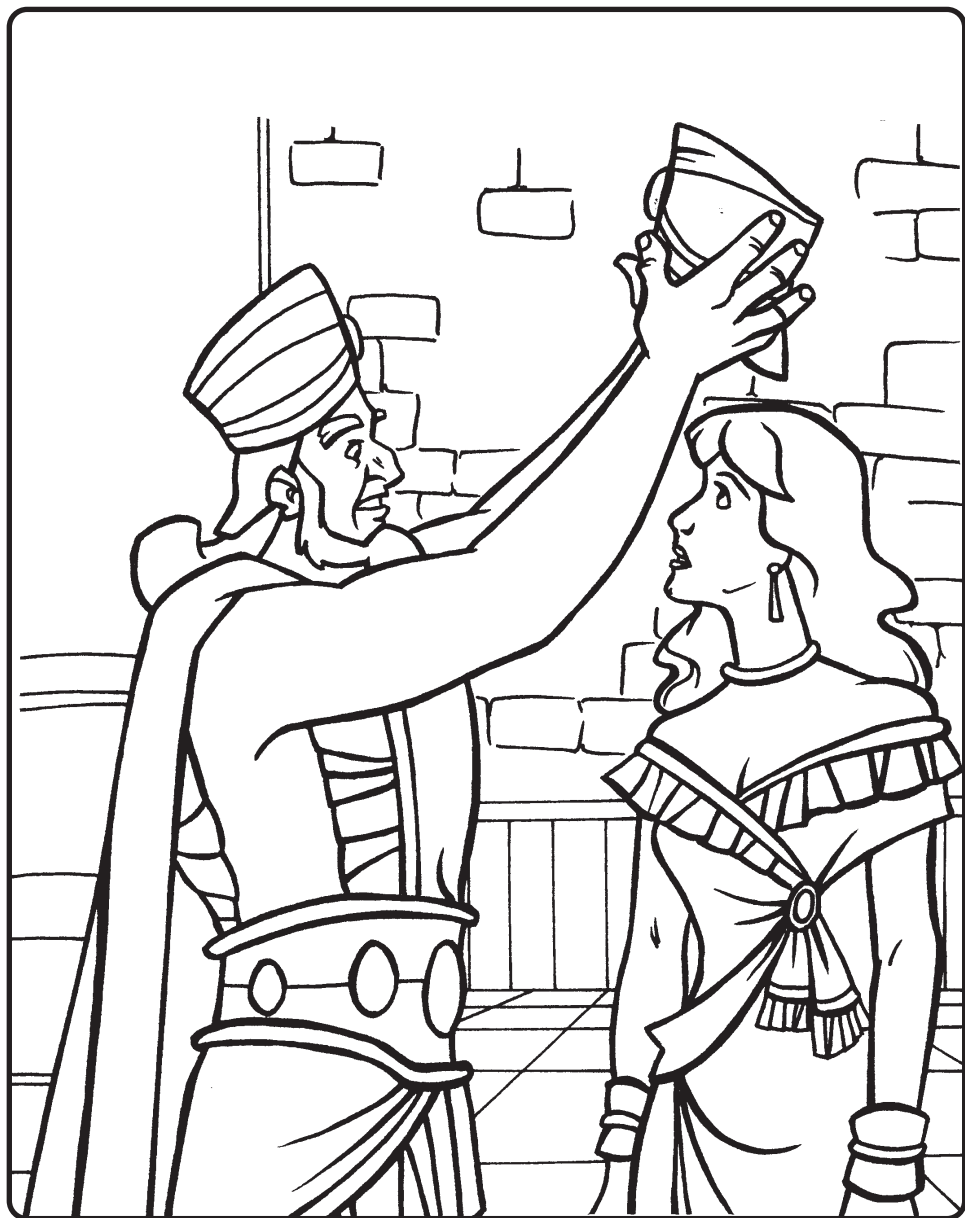
Љиљана Ћирић Дечја суботна школа, ЈИЕУ - Београд