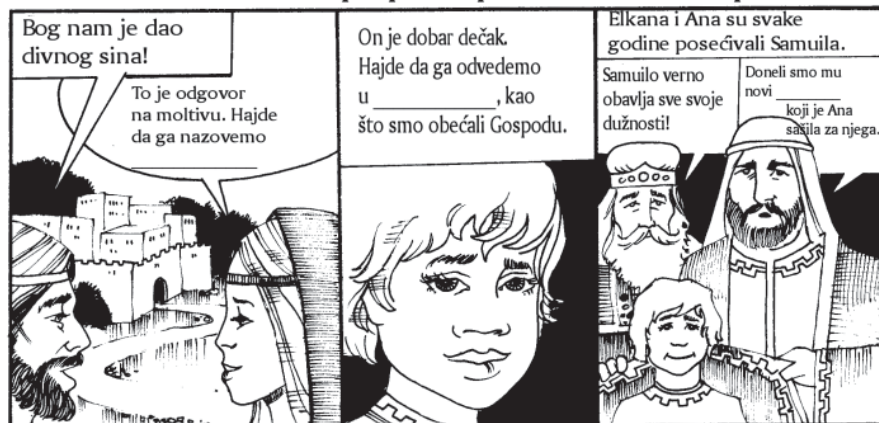
Samuilo, Samson, Saul

Izaberi tačne reči i popuni praznine u stripu.